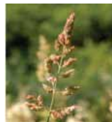
Phalaris arundinacea www.poggen.unimaas.nl

Herbacées : Espèces de graminées comme Phalaris arundinacea , Bromus inermis et Poa spp. et des espèces non graminéides comme Eupatorium maculatum , Aster spp. , Solidago spp. , Impatiens capensis et Onoclea sensibilis .