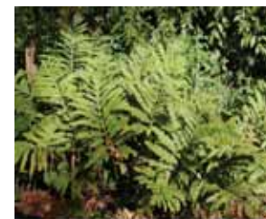
Onoclea sensibilis www.muhlenberg.edu

Les bandes riveraines peuvent améliorer grandement la qualité des cours d'eau. Il s'agit simplement d'y mettre un peu du sien.