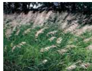
Bromus inermis