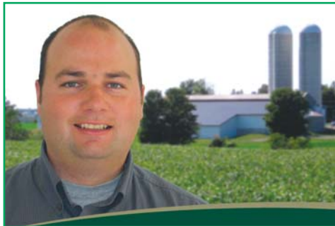
Exhibit Coop ...